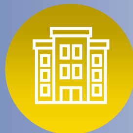
Soluzioni Per Condomini