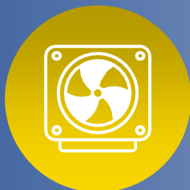
Impianti Di Climatizzazione